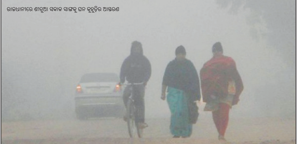
ରାଜଧାନୀରେ ଶୀତୁଆ ସକାଳ ସାଲକୁ ଘନ କୁହୁଡ଼ିର ଆସ୍ତରଣ

ଥାନା ପୋଲିସ ଏ ସଂକ୍ରାନ୍ତରେ ୭/୧୯ ରେ ଏକ ମାମଲା ରୁଜୁ କରି ତଦନ୍ତ ଆରମ୍ଭ କରିଥିଲା । ଘଟଣାରେ ସମ୍ପୃକ୍ତ ନାବାଳିକାଙ୍କୁ ବିଭିନ୍ନ ପ୍ରକାରର ଦେଖାଇ ତାଙ୍କ ସହିତ ଶାରୀରିକ ସମ୍ପର୍କ ରଖିଥିଲେ ସୁପ୍ରୀମ କାଲ । ଶିଶୁ ଯୌନ ନିରୋଧ ଆଇନ ବଳରେ ପୋଲିସ ଆଜି ଗିରଫ କରି କୋର୍ଟଚାଲାଶ କରିଛି । ସେ ପୂର୍ବରୁ ବିବାହିତ ବୋଲି ଜଣାପଡ଼ିଛି । ଅନ୍ୟପକ୍ଷରେ (ପୃଷ୍ଠା-୭)