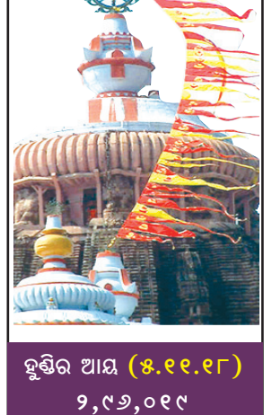
ହୁଣ୍ଡିର ଆୟ ($ ୧୧.୧୮) ୨,୯୬,୦୧୯

ଆରମ୍ଭ ହୋଇଥିବା କଣାପଡ଼ିଛି । ଏଠାରେ ଭେଲୁକ୍ଷି ଯୋଗ୍ୟ, ଗଡ଼ଜାଲି ଦିନ ଟଙ୍କେ ଜଣେ ପୋଲିସ୍ ଅଧିକାରୀ ଏବଂ ଦିଲ୍ଲୀର ଜଣେ ମହିଳା ଶ୍ରୀମନ୍ଦିର ଭିତର ପଟୋ ଭାଇରାଲ କରିଥିଲେ । ତେବେ ସମ୍ପୂର୍ଣ୍ଣ ପୋଲିସ୍ କର୍ମଚାରୀଙ୍କୁ କାର୍ଯ୍ୟରୁ ନିଲମ୍ବନ ମଧ୍ୟ କରାଯାଇଥିଲା ।