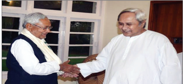
ନାତିଶଙ୍କ ସହ ସାକ୍ଷାତ ଆଲୋଚନା