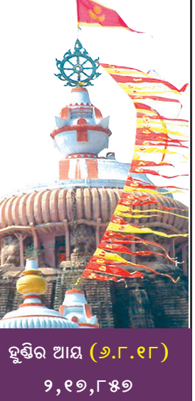
ହୁଣ୍ଡିର ଆୟ (୬.୮.୧୮) ୨,୧୭,୮୫୭