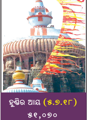
ହୁଣ୍ଡର ଆୟ (୫୭.୧୮) ୫୧,୦୭୦