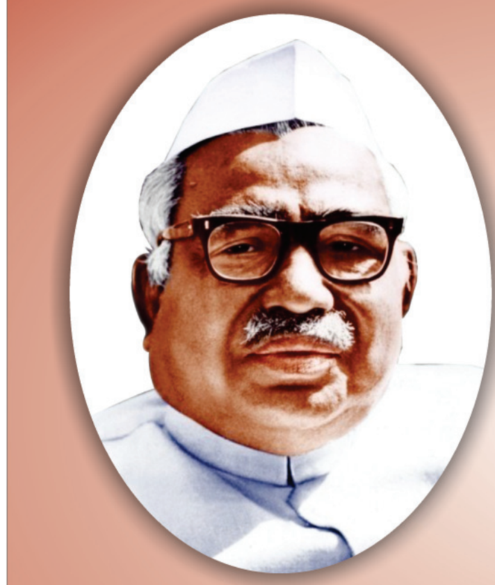
ସ୍ଥାନ : ସମତା ସ୍ଥଳ, ରାଜସାଙ୍ଗପାଶୁ, ନୂଆଦିଲ୍ଲୀ ତାରିଖ : ୬ ଜୁଲାଇ, ୨୦୧୮ ଶୁକ୍ରବାର | ସମୟ: ସକାଳ ୭.୩୦ ସମୟରୁ ୮.୦୦ ପର୍ଯ୍ୟନ୍ତ

ଏସ୍‌ମା ଅବଧି ୬ ମାସ ବୃଦ୍ଧି ଭୁବନେଶ୍ୱର, ୫୬ (ସକାଳ ଖବର): କରୁଣାକାଳୀନ ସେବା ଅତ୍ୟାବଶ୍ୟକ ସେବା ସଂସ୍ଥା ମାନଙ୍କରେ କାର୍ଯ୍ୟକାରୀ ଥିବା କର୍ମଚାରୀ ମାନଙ୍କର ଆୟୋଗ୍ୟ ଉପରେ ରାଜ୍ୟ ସରକାରଙ୍କ ପକ୍ଷରୁ ପୂର୍ବରୁ ଜାରି କରାଯାଇଥିବା କଟକଣା ଏସମାର ଅବଧି (ପୃଷ୍ଠା-୭)