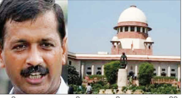
ନୂଆଦିଲ୍ଲୀ, ୩୩୭ : କେନ୍ଦ୍ରଶାସିତ ପ୍ରଦେଶ ବିଲ୍ଲୀର ପ୍ରକଟ 'ବସ୍' କିଏ । ପ୍ରଦେଶରେ ଜନତାଙ୍କ ଦ୍ଵାରା ନିର୍ବାଚିତ ସରକାର ନା କେନ୍ଦ୍ର ସରକାର ନେଇ ଦାୟିତ୍ଵ ନେବେ ଆମ୍ଭ ଆମ୍ଭ ପାଇଁ

କ୍ଷୁଦ୍ରନେଶ୍ଵର, ୩୩୭ (ସକାଳ ଖବର): ଓଡ଼ିଶାରେ ବିଧାନ ପରିଷଦ ଗଠନ ପ୍ରସଙ୍ଗରେ ଅନ୍ୟ ରାଜ୍ୟର ବ୍ୟବସ୍ଥା ଅନୁଧ୍ୟାନ ପାଇଁ ମନ୍ତ୍ରୀମଣ୍ଡଳର ଉପସ୍ଥିତି ଆସନ୍ତାକାଲି ବିହାର ଗସ୍ତରେ ଯିବା ପାଇଁ ପ୍ରମୁଖ ସମ୍ପର୍କରେ ବିଧାନ ପରିଷଦର ବିଧାନ ସଭା ସଭାପତିଙ୍କୁ ସୂଚନା ଦିଆଯାଇଥିଲା । ଏହାପରେ ବିଧାନ ପରିଷଦର ବିଧାନ ସଭା ସଭାପତିଙ୍କୁ ସୂଚନା ଦିଆଯାଇଥିଲା ।