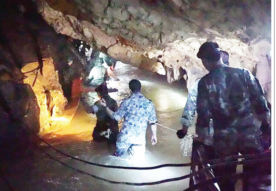
ବି. କୁକୁରୁ ବୋଟିଥିଲେ ସରିବ । ପିଲାଙ୍କ ସହିତ କୋଟ ମଧ୍ୟ ଜୀବନ ବିକଳରେ ବୋଟି ପକାଇଥିଲେ । କିଛି ବୃଦ୍ଧିବା ପୂର୍ବରୁ ନିକଟରେ ଥିବା ଗୁମ୍ଫା ଭିତରେ ପଶି ଯାଇଥିଲେ ଉଭୟ କୋଟ ଓ ୧୨ ଜଣ ପିଲା । ଏହାପରେ ସେଠାରେ ଲଗାଣ ବର୍ଷ ହେବା ପରେ ଗୁମ୍ଫାରେ ପାଣି ପଶିଯାଇଥିଲା ।