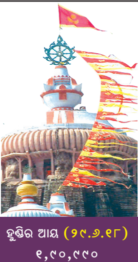
ହୁଣ୍ଡିର ଆୟ (୨୯.୬.୧୮) ୧,୯୦,୯୯୦