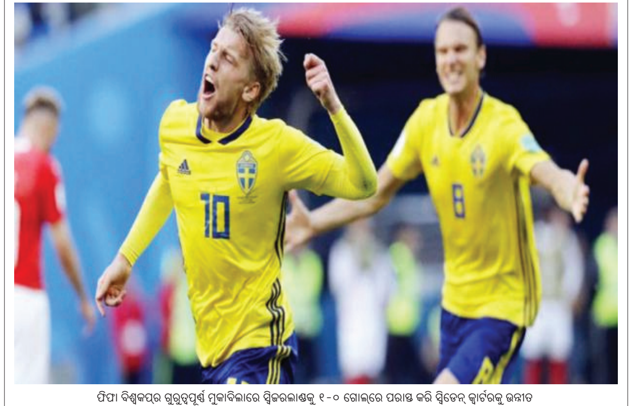
ଫିଫା ବିଶ୍ଵକପର ଗୁରୁତ୍ଵପୂର୍ଣ୍ଣ ମୁକାବିଲାରେ ସ୍ଵିଜରଲ୍ୟାଣ୍ଡକୁ ୧-୦ ଗୋଲରେ ପରାସ୍ତ କରି ସ୍ଵିଡେନ୍ କାର୍ତ୍ତବ୍ୟକୁ ଉନ୍ନତ