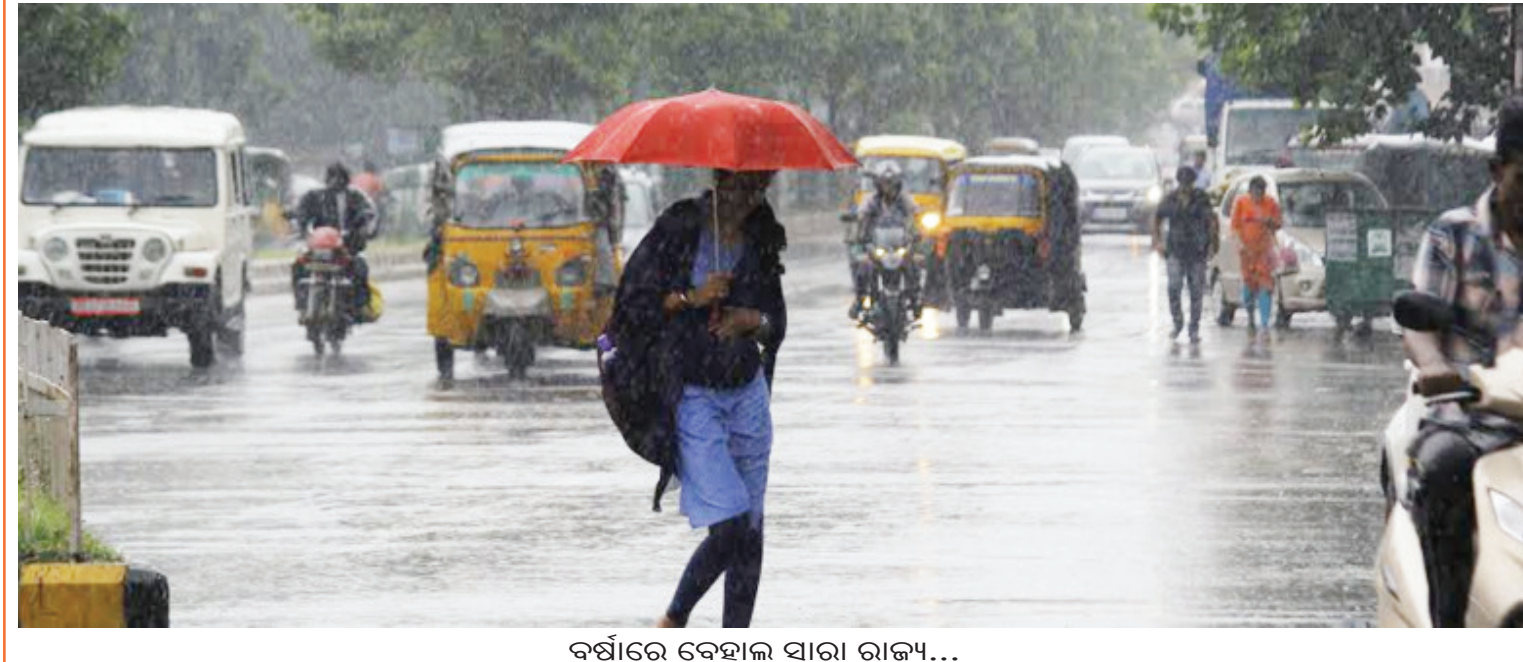
ବର୍ଷାରେ ବେହାଲ ସାରା ରାଜ୍ୟ...