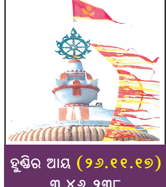
ହୃଦିର ଆୟ (୨୬.୧୧.୧୭) ୩,୪୬,୨୩୮