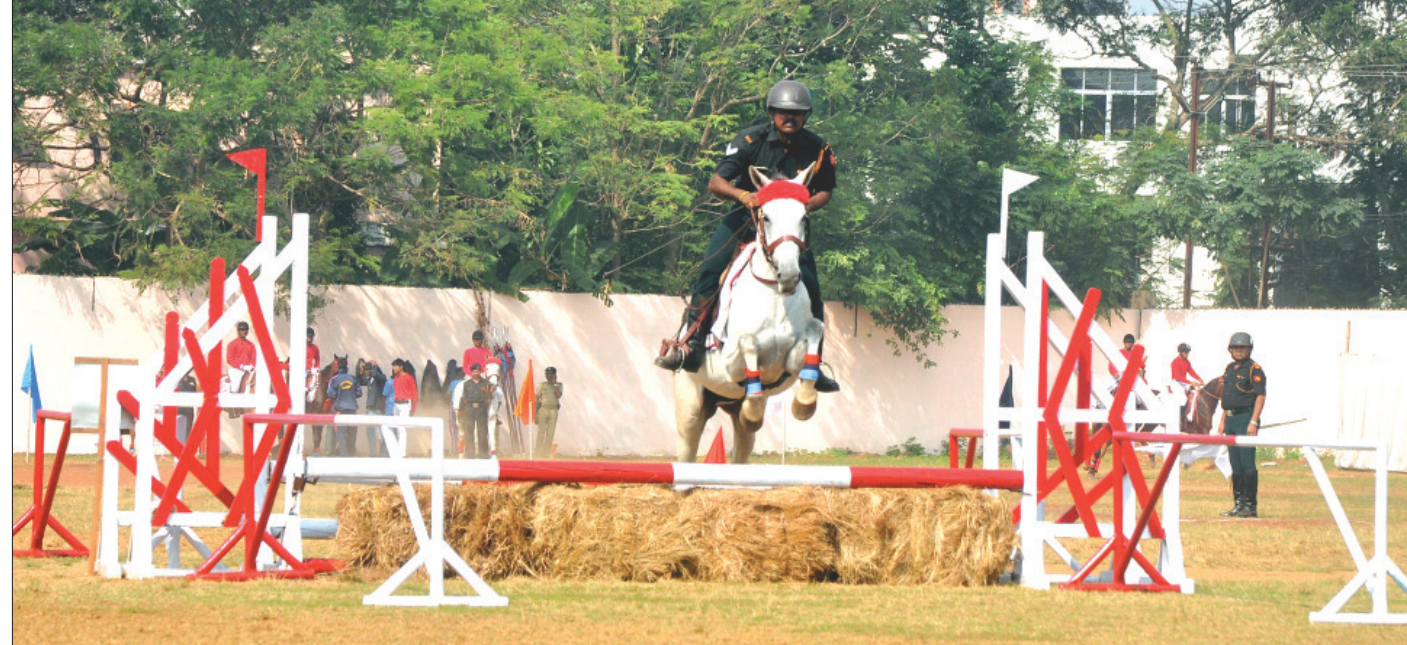
ବିଭିନ୍ନ କଲେଜ ଗ୍ରାହଣରେ ଏନସିସି ଦିବସ ପାଳନ ଉପଲକ୍ଷେ ଜଣେ ଏନସିସି କ୍ୟାଡେଟ୍‌ଙ୍କୁ କ୍ୱାଡ୍ରା ନୈମ୍ନେଶ୍ୱର ପ୍ରଦର୍ଶନ ।

ଘୁଣ୍ଟିଚନ, ୨୬.୧୧: ପାକିସ୍ତାନର ପରମାଣୁ ହତ୍ତିଆର ନା କେବଳ ସୀମା ସୁରକ୍ଷା ପାଇଁ ଉନ୍ନତ ବରଂ ପରମାଣୁ ସୁଖ ପାଇଁ ଏକ ସଚିବ ବାଟ। ଏହି କଥା ମନ ଗଢ଼ା ନୁହେଁ, ଆମେରିକା ଥିଲ ଚ୍ୟାଙ୍କ ଏକ ରିପୋର୍ଟରେ ଏହି ତଥ୍ୟ ପ୍ରକାଶ କରିଛି। ଆଣ୍ଟାର୍କଟିକ କାଉଁସିଲ ନିକଟ ରିପୋର୍ଟ ଏସିଆ ଉପ ସେକ୍ଟର ନ୍ୟୁକ୍ଲିୟର ଏକ୍ସପ୍ରେସନ୍ କରାଯାଇଛି ପାକିସ୍ତାନ ଏପରିକି ତାର ପରମାଣୁ ହତ୍ତିଆର ଯୋଜନାର ସଂଚାଳନ ଆରମ୍ଭ କରିନାହିଁ। ତଳିତ ମାସରେ କାରି ହୋଇଥିବା ଏକ ରିପୋର୍ଟରେ କୁହାଯାଇଛି ଯେ ପାକିସ୍ତାନର ପରମାଣୁ ହତ୍ତିଆର କାର୍ଯ୍ୟକୁ କେବଳ ସୀମା ସୁରକ୍ଷା ପାଇଁ ଉନ୍ନତ ବାଟ ନୁହେଁ ବରଂ ଏହା ଏକ ସାମାନ୍ୟ ଝଗଡ଼ାକୁ ପରମାଣୁ ସୁଖରେ ପରିଣତ କରିପାରେ।