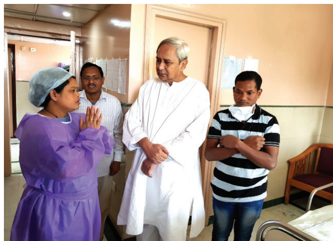
ନୂଆଦିଲ୍ଲୀ: ପୁଅଙ୍କୁ କରାଯାଇଥିବା ଯୋଗ୍ୟତାକୁ ଶିଶୁ ଜଗା-କାଳିଆଙ୍କୁ ଦେଖିବା ପାଇଁ ନବୀନଙ୍କୁ ଦିନ ପୁଣ୍ୟମଣି ନବୀନ ପଦନାୟକ ବିଲ୍ଲାସିତ ଅଖି ଭାରତୀୟ ଆୟୁର୍ବିଜ୍ଞାନ ସଂସ୍ଥାନକୁ (ଏମ୍.ଏ.)