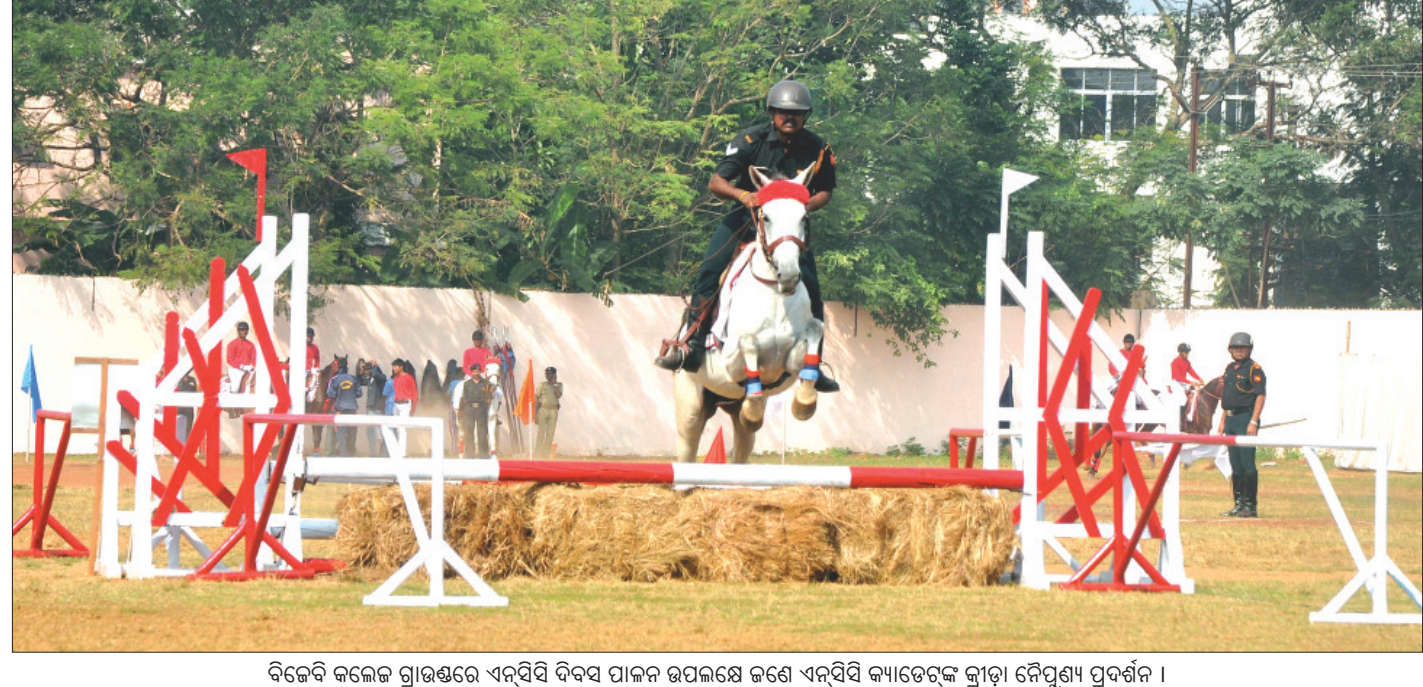
ବିଭେଦି କଲେଜ ଗ୍ରାଉଣ୍ଡରେ ଏନସିସି ଦିବସ ପାଳନ ଉପଲକ୍ଷେ ଜଣେ ଏନସିସି କ୍ୟାଡେଟ୍‌ଙ୍କୁ କ୍ୱାଡ୍ରା ନୈମ୍ନେଶ୍ୱର ପ୍ରଦର୍ଶନ।

ରିପୋର୍ଟରେ ଉଲ୍ଲେଖ କରାଯାଇଛି ଯେ ପରମାଣୁ ଅସ୍ତ୍ର ଉଦ୍ଧାର ନୁହେଁ ଏହାର ପରିଚଳନାକାରୀ ସଂଖ୍ୟା ଗୁଡ଼ିକ ଅଧିକ ଉଦ୍ଧାର। କାରଣ ପାକିସ୍ତାନ ଭଳି ଦେଶ ସିରତା ଉପରେ ଭରସା କରିବା ମୁଖ୍ୟମନ୍ତ୍ରୀ ହେବ। ରିପୋର୍ଟରେ କୁହାଯାଇଛି ଯେ ଗତ ବାର ବର୍ଷ ମଧ୍ୟରେ ପାକିସ୍ତାନ ଆତଙ୍କବାଦ ମାଧ୍ୟମରେ ଆପତାନିଷ୍ଠାନ ଓ ଭାରତରେ ଯେଉଁଭଳି ଭାବେ ଅଖାଡ଼ି ସୃଷ୍ଟି କରିଛି ତାହା ବିଚାରନକ। ରିପୋର୍ଟରେ କୁହାଯାଇଛି ଯେ ପାକିସ୍ତାନର ଅନେକ ରାଜ୍ୟରେ ମଧ୍ୟ ଆକ୍ରମଣ ହୋଇଛି। ପାକିସ୍ତାନ ପରମାଣୁ ହତ୍ତିଆର ରଖିଥିବା ଭଳି କିଛି ସମ୍ବେଦନଶୀଳ ସ୍ଥାନରେ ମଧ୍ୟ ଆକ୍ରମଣ କରାଯାଇଛି। ଏହି ଆକ୍ରମଣ ପଛରେ କିଛି ପାକିସ୍ତାନର କିଛି ଲୋକଙ୍କ ହାତ ଥିବା କୁହାଯାଇଛି।