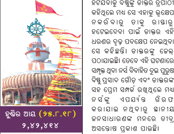
ହୁଣ୍ଡିର ଆୟ (୨୫.୮.୧୮) ୨,୪୨,୪୧୪

ମାଛ ଗୋଦାମ ଓ ବଜାରରୁ ନମୁନା ସଂଗ୍ରହ କରାଯାଇ ବାବୁଙ୍କୁ ସ୍ଥିତ ସିଆଇଏସଏଅରଆଇ ଦ୍ୱାରା ପ୍ରସ୍ତୁତ ଫର୍ମାଲିନ୍ କିଟ୍ ଦ୍ୱାରା ତତ୍କାଳ ପରୀକ୍ଷା କରାଯାଇଥିଲା। ଏହି ନମୁନା ଗୁଡ଼ିକ ମଧ୍ୟରୁ ଗୋଟିଏ ସାମୁଦ୍ରିକ ମାଛରେ ଫର୍ମାଲିନ୍ ଥିବାର ସଂକେତ ମିଳିଥିଲା। ଉପରୋକ୍ତ ସମୟରେ ମଧ୍ୟ ବିଭାଗ ଓ ଶାସନ ନିରାପତ୍ତ ଅଧିକାରୀଙ୍କ ମିଳିତ ସହଯୋଗରେ ମାଛ ନମୁନା ସଂଗ୍ରହ କରାଯାଇ ରାଜ୍ୟ ସ୍ତରୀୟ ଖରୀଦାଦାସ ନିରାପତ୍ତ କମିଶନର କ ପରୀକ୍ଷା ପରୀକ୍ଷା କରାଯାଇଛି।