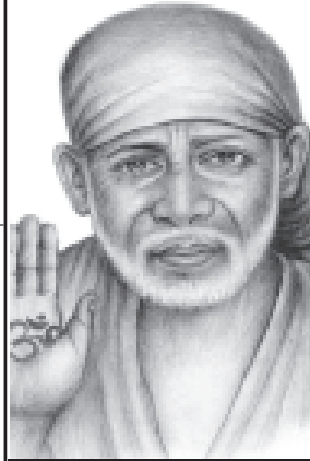
ଭଲ ପାଇବା ଓ ଭଲ ସହିତ ଦାନ କରନ୍ତୁ