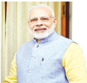
କାର୍ଯ୍ୟକାରୀ ହେବା ଆବଶ୍ୟକ । କଳ ସଂରକ୍ଷଣ, କୃଷି, ମନରେଗା ଆଦି ପ୍ରସଙ୍ଗରେ ମୁଖ୍ୟମନ୍ତ୍ରୀଙ୍କ ଦ୍ୱାରା ଦିଆଯାଇଥିବା ବିଭିନ୍ନ ପରାମର୍ଶର ସେ ପ୍ରଶଂସା କରିଥିଲେ । ଉତ୍ତର ପଞ୍ଚବ ବୁଣିବା ଏବଂ କାଟିବା ପର୍ଯ୍ୟାୟ ସମେତ କୃଷି ଏବଂ ମନରେଗା ଆଦି ବୁଦ୍ଧି ବିଶୟରେ ସମନ୍ୱିତ ନୀତି ଓ ଆଭିମୁଖ୍ୟ ଗ୍ରହଣ ସହିତ ଆବଶ୍ୟକ ସୁପାରିସ

କରିବା ପାଇଁ ମିଳିତ ଭାବେ କାର୍ଯ୍ୟ କରିବା ଲାଗି ସେ ମଧ୍ୟପ୍ରଦେଶ, ବିହାର, ସିକିମ, ଗୁଜରାଟ, ଉତ୍ତରପ୍ରଦେଶ, ପଶ୍ଚିମବଙ୍ଗ ଏବଂ ଆନ୍ଧ୍ର ପ୍ରଦେଶରେ ମୁଖ୍ୟମନ୍ତ୍ରୀମାନଙ୍କୁ ଆହ୍ୱାନ କରିଥିଲେ । ପ୍ରଧାନମନ୍ତ୍ରୀ କହିଥିଲେ ଯେ ଆଡ଼ିଏ ସହାୟତା ଶେଷରେ ବସିଥିବା ବ୍ୟକ୍ତି ବିଶେଷକୁ ଚିହ୍ନିତ କରିବା ଗୁରୁତ୍ୱପୂର୍ଣ୍ଣ, ଯାହାଦ୍ୱାରା ସରକାରୀ ଯୋଜନାର ଲାଭ ସେମାନଙ୍କ ନିକଟରେ ପହଞ୍ଚିପାରିବ । ସେହିପରି ସେ କହିଥିଲେ ଯେ ସାମାଜିକ ନ୍ୟାୟ ଏକ ଗୁରୁତ୍ୱପୂର୍ଣ୍ଣ ପ୍ରଶାସନିକ ଲକ୍ଷ୍ୟ । ସେ କହିଥିଲେ ଯେ ଏହି ଉଦ୍ଦାର ଲକ୍ଷ୍ୟ ହାସଲ ପାଇଁ ନିବିଡ଼ ସମ୍ପୂର୍ଣ୍ଣ ଏବଂ ନିରନ୍ତର ଅନୁଧ୍ୟାନ ଆବଶ୍ୟକତା ରହିଛି । ଅଗଷ୍ଟ ୧୫, ୨୦୧୮ ପୂର୍ବ