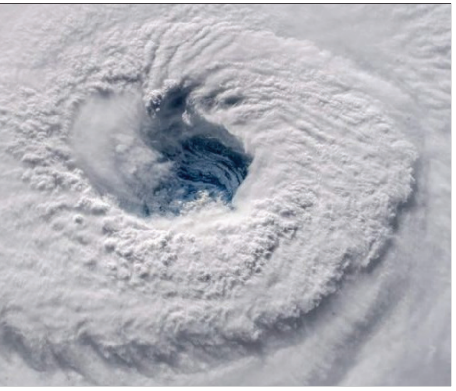
ଦକ୍ଷିଣ ଚୀନ ଉପକୂଳରେ ମାତ ହେଲା ମହାବାତ୍ୟା ମାଣ୍ଡୁ

ଦୁଇ ବା, ଫୋନ୍, କଲ ତଥା ଏସ୍.ଏମ୍.ଏସ୍. ପ୍ରଦାନର ମାଧ୍ୟମ କରିଥାନ୍ତି । ତେବେ ନିର୍ବାଚନ ଆୟୋଗଙ୍କ ଏହି କଡ଼କଣା ପରେ ଏବେ ପୋଲିସ୍, ଏସ୍.ଏମ୍.ଏସ୍ ଏବଂ ହାଉସିଂ ଡିଭିଜନ୍ ପ୍ରାର୍ଥୀଙ୍କ ଘରଘର ଦୁଇ ବା ଉପରେ ଅଧିକ ଲାଗିଯାଇଛି । ଏହାକୁ ଅମାନ୍ୟ କଲେ ପ୍ରାର୍ଥୀମାନଙ୍କ ଉପରେ ତତ୍କାଳିନୀ କାର୍ଯ୍ୟାନୁଷ୍ଠାନ ନିଆଯିବ । ଆୟୋଗଙ୍କ ଦ୍ଵାରା ଏଭଳି ନିୟମ କରିବା ପଛରେ ନାଗରିକଙ୍କ ନିକଟ୍ଵ ସମ୍ମାନ ତଥା ସାମାଜ୍ୟ ଜନଜୀବନରେ ଆଶାଧିକ୍ୟ ବ୍ୟବସ୍ଥାନକୁ ରୋକିବା ମୁଖ୍ୟ କାରଣ ବୋଲି ଦର୍ଶାଯାଇଛି । ଅନ୍ୟ ଏକ ଗୁରୁତ୍ଵପୂର୍ଣ୍ଣ ନିଷ୍ପତ୍ତିରେ ନିର୍ବାଚନ ସଂସ୍କାର ପାଇଁ ଭାରତୀୟ ନିର୍ବାଚନ କମିସନ୍ (ପୃଷ୍ଠା-୭)