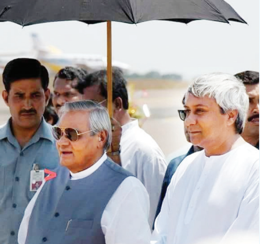
୧୯୯୯ ମସିହାରେ ମହାବାତ୍ୟା ପ୍ରଭାବରେ ଯେତେବେଳେ ଅଧ୍ୟାପକ ଓଡ଼ିଶା ଧୂଷ ବିଧୂଷ ହୋଇଥିଲା ସେତେବେଳେ ପ୍ରଭୁର ସାହାଯ୍ୟ ଓ ସମର୍ଥନ ଯୋଗାଇ ଦେଇଥିଲେ । ମହାବାତ୍ୟାରେ ଯେତେବେଳେ ବାସନ୍ତରୁପିକ ଧୂଳିସାତ ହୋଇଗଲା ଓଡ଼ିଶାର ପ୍ରଭାବିତ ଜନତାଙ୍କୁ ଚିଲିପ ଓ ପୁନର୍ବାସ ପାଇଁ ଗୁରୁତ୍ୱ ଲୁମ୍ବିକା

ଦେଶପ୍ରେମ ସମ୍ବଳିତ ଏକାଧିକ ପ୍ରତ୍ୟୁତ୍ପନ୍ନୀର ସମ୍ପାଦନା ଦାୟିତ୍ୟରେ ଥିଲେ ସେ । ଅବିବାହିତ ରହିବାର ନିଷ୍ପତ୍ତି ନେଇଥିବା ବାଜପେୟୀ ଭାରତୀୟ ଜନସଂଘର ପ୍ରତିଷ୍ଠାତା ସଦସ୍ୟ ଥିଲେ ଏବଂ ୧୯୬୮ରୁ ୧୯୭୩ ମସିହା ଯାଏ ଏହାର ଜାତୀୟ ଅଧ୍ୟକ୍ଷ ଭାବେ କାର୍ଯ୍ୟ କରିଆସିଥିଲେ । ୧୯୫୭ ଲୋକସଭା ନିର୍ବାଚନରେ ପ୍ରଥମ ଥର ଭରତପ୍ରଦେଶର ବଳରାମପୁର ଆସନରୁ ଜନସଂଘ ପ୍ରାର୍ଥୀ ଭାବେ ନିର୍ବାଚିତ ହୋଇ ସଂସଦରେ ପହଞ୍ଚିଥିଲେ ସେ । ୧୯୫୭ରୁ ୧୯୭୭ ମସିହା ଯାଏ କ୍ରମାଗତ ଭାବେ ଜନସଂଘ ପକ୍ଷରୁ ସଂସଦୀୟ ସଦସ୍ୟ ନେତୃ ନେଇଥିଲେ । ୧୯୭୭ ମସିହାରେ ପ୍ରଥମ ଥର ଜନତା ପାର୍ଟି ନେତୃରେ ଅଣ୍ଟିକ ଗ୍ରେସ ସରକାର ଗଠିତ ହୋଇଥିବା ବେଳେ ସରକାର ନେତୃ ନେଇଥିଲେ ମୋରାରଜୀ ଦେଶାୟ । ସେତେବେଳେ ଅଟଳ ବିହାରୀ