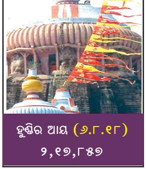
ହୁଣ୍ଡିର ଆୟ (୬.୧୮) ୨,୧୭,୮୫୭

କେରଳ ବନ୍ୟା ପୀଡ଼ିତଙ୍କ ପାଇଁ ମୁଖ୍ୟମନ୍ତ୍ରୀଙ୍କ ୫ କୋଟି ଟଙ୍କା ସହାୟତା ଘୋଷଣା