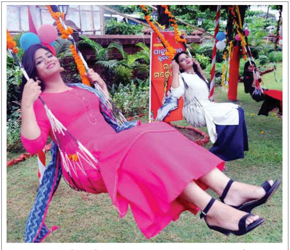
ରାଜଧାନୀସ୍ଥିତ ପାଇନିବାସ ଠାରେ ରଜ ମହୋତ୍ସବ ଧୂମ୍ପାମ୍ରେ ପାଳନ କରାଯାଇଛି

ପୁରୀ, ୧୩।୬ (ସକାଳ ଖବର): ସେବାୟତଙ୍କ ଦାନ ଗ୍ରହଣ ଉପରେ ସୁପ୍ରିମକୋର୍ଟଙ୍କ କଟକଣା ନିର୍ଦ୍ଦେଶ ପରେ ଚିହ୍ନି ଉଠିଛି ଶ୍ରୀମନ୍ଦିର ପ୍ରଶାସନ । ସର୍ବୋଚ୍ଚ ନ୍ୟାୟାଳୟଙ୍କ ନିର୍ଦ୍ଦେଶକୁ ଅକ୍ଷରରେ ଅକ୍ଷରରେ ପାଳନ କରିବାରେ ଲାଗିଛି । ଏହି ପରିପ୍ରେକ୍ଷାରେ ଆଜି ଭକ୍ତଙ୍କ ଠାରୁ ଦାନ ଗ୍ରହଣ ନକରିବାକୁ ପ୍ରଶାସନ ନିର୍ଦ୍ଦେଶନାମା ଜାରି କରାଯାଇଛି । ସମସ୍ତ ନିଯୋଗକୁ ଚିଠି ମାଧ୍ୟମରେ ଏସଂକ୍ରାନ୍ତରେ ଜଣାଇବା ସହ ଭକ୍ତଙ୍କଠାରୁ ଦାନ ଅର୍ଥ ଗ୍ରହଣ ନକରିବାକୁ ଚିଠିରେ ଉଲ୍ଲେଖ ରହିଛି । କିଛି ଭକ୍ତମାନେ ନିଜର ଦାନ ବାନ୍ଧିଶା ସେବାୟତଙ୍କୁ ନଦେଇ ହୁଣ୍ଡିରେ ପକାଇବେ ସେ ନେଇ ଭକ୍ତଙ୍କୁ ସହଯୋଗ କରିବାକୁ ଚିଠିରେ କୁହାଯାଇଛି । ଏତଦନ୍ତର୍ଗତ ମନ୍ଦିର ପରିସରରେ ଭକ୍ତଙ୍କୁ ଦାନ ପାଇଁ ସେବାୟତମାନେ ବାଧ୍ୟ କରିପାରିବେନି । ସେବକ, ସହଗାମୀ ଓ ଶ୍ରୀମନ୍ଦିର କର୍ମଚାରୀ ଭକ୍ତଙ୍କୁ ମହାପ୍ରଭୁଙ୍କ ଦର୍ଶନରେ ବାଧା ଦେଇପାରିବେ ନାହିଁ ବୋଲି ଚିଠିରେ ବର୍ଣ୍ଣାଯାଇଛି ।