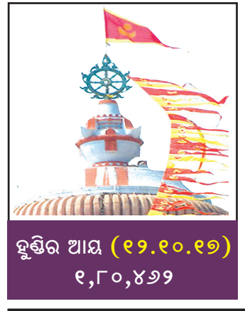
ହୃଦୟ ଆୟ (୧୨.୧୦.୧୭) ୧,୮୦,୪୬୨