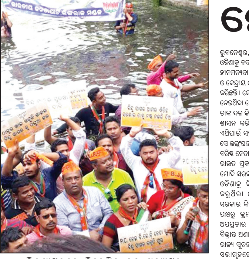
ବିନ୍ଦୁସାଗରରେ ବିଜେପିର ଜଳ ସତ୍ୟାଗ୍ରହ