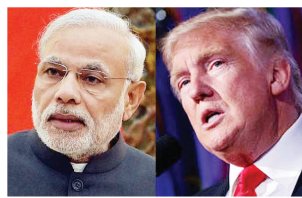
ଡେଲ ଆମଦାନୀ ପାଇଁ ଅର୍ଡ଼ ବିଆସରିଛି? ଉଲ୍ଲେଖନୀୟ ଚଳିତ ବର୍ଷ ମେ ମାସରେ ଆମେରିକା ଭାରତ ସହ ହୋଇଥିବା ପରମାଣୁ ରାଜିନାମା ଓହରି ଯାଇଥିଲା । ଦୁଇ ଦେଶ ମଧ୍ୟରେ ୨୦୧୪ରେ ପରମାଣୁ ରାଜିନାମା ହୋଇଥିଲା । ଏବେ ଟ୍ରମ୍ପ ଭାରତକୁ ଚୈକ ଆମଦାନୀ କରୁଥିବା ଦେଶଗୁଡ଼ିକୁ ଦେଖି ନେବି ବୋଲି କହିଛନ୍ତି । ଟ୍ରମ୍ପ ଭାରତ ସହ ରାଜିନାମା

ଓ଼ିଶା, ୧୧।୧୦: ଭାରତ ବିରୋଧରେ ନଭେମ୍ବର ୪ରୁ ଆରମ୍ଭ ହେଉଛି ଆମେରିକାର ନୂତନ ପ୍ରତିବନ୍ଧକ । ମାତ୍ର ଏହି ପ୍ରତିବନ୍ଧକକୁ ମାନୁନଥିବା ଦେଶକୁ ଆମେରିକା ଗୁରୁବାର ଚେତାବନୀ ଦେଇଛି । ଆମେରିକା ରାଷ୍ଟ୍ରପତି ଡେଲ ଆମଦାନୀ କରୁଥିବା ଦେଶଗୁଡ଼ିକୁ କ୍ଷମା ଶବ୍ଦରେ ଚେତାବନୀ ଦେଇ କହିଛନ୍ତି ଯେ ଯଦି ପ୍ରତିବନ୍ଧକ ଲାଗୁ ହେବା ଦିନ ପର୍ଯ୍ୟନ୍ତ କୌଣସି ଦେଶ ଭାରତକୁ ଚୈକ ଆମଦାନୀ ସଂପୂର୍ଣ୍ଣ ବନ୍ଦ ନକରନ୍ତି ତେବେ ସେହି ଦେଶ ଗୁଡ଼ିକୁ ଓ଼ିଶା ଚେତାବନୀ ଦେଖି ନେବ । ଅନ୍ୟପକ୍ଷେ ଏହାର ହୁଲ୍ ଦିନ ପୂର୍ବରୁ ଭାରତ ଦୋଷୀ ଶୁଣାଣି କରିଥିଲା ଯେ ଦେଶର ଆବଶ୍ୟକତାକୁ ଦୃଷ୍ଟିରେ ରଖି ନଭେମ୍ବରରେ ଭାରତକୁ