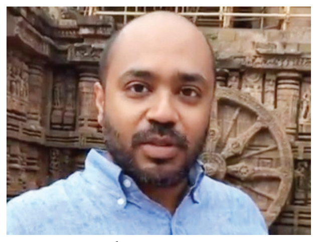
ତେବେ ଗୃହ କମିଟିରେ ଧାର୍ଯ୍ୟ ଦିନରେ ହାଜର ହୋଇପାରିବେନି ବୋଲି ଗୁରୁବାର ଆଇ ଏକ ଡିଓ ଲେଖିଛନ୍ତି । ତାଙ୍କ ଆବେଦନକୁ (ପୃଷ୍ଠା-୭)