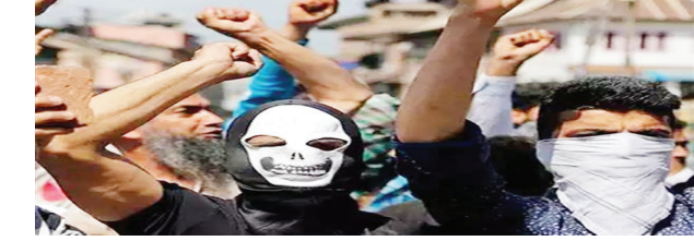
କେଲି ଫେଲ ମାରିବା ପରେ ଏବେ ଛାତ୍ରଙ୍କୁ ଗାନ୍ଧିଜୀ କରାଯାଉଛି । ଏବେ ଅପରେସନ ସ୍ତୃତ୍ୟ କରିଆରେ ଆତଙ୍କୀ ନିଜର ଯୋଜନାକୁ ସଫଳ କରିବା ପାଇଁ ଉଦ୍ୟମ କରୁଛନ୍ତି । ସୁରକ୍ଷା ଏଜେନ୍ସିର ପୁତ୍ର ମୃତ୍ୟୁବଦ୍ଧ ବାହାର ଆତଙ୍କବାଦୀଙ୍କ ଅନୁପ୍ରବେଶ ଉପରେ

ନୂଆଦିଲ୍ଲୀ, ୧୧।୧୦: ଜାମ୍ମୁ ଓ କାଶ୍ମୀରରେ ଆତଙ୍କବାଦକୁ ପ୍ରୋତ୍ସାହିତ କରିବା ପାଇଁ ଏବେ ଅନ୍ୟ ରାଜ୍ୟରେ ପଠୁଥିବା ଜାମ୍ମୁ-କାଶ୍ମୀର ଛାତ୍ରଙ୍କୁ ଗାନ୍ଧିଜୀ କରାଯାଉଛି । ପୁତ୍ର ମୃତ୍ୟୁବଦ୍ଧ କେଶବ ବାହାର କରାଯାଇ ଆତଙ୍କବାଦ ଘଟଣା ଘଟାଇବାକୁ ଉଦ୍ୟମ ଅପରେସନ