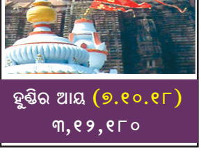
ହୃଦ୍ୱିର ଆୟ (୭.୧୦.୧୮) ୩,୧୨,୧୮୦